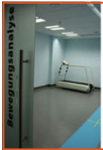
Analysen im Messraum, hier mit Laufband und Gehstrecke