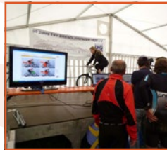
Analysen bei Sportevents, mobil und kalibriert mit Laptop oder iPad