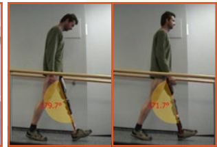
Ganganalyse Rampe und Treppe