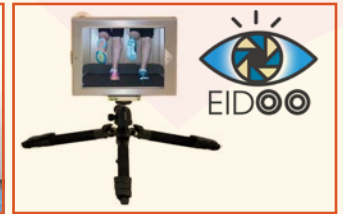
i-Pad Lösung EID00, für den mobilen Einsatz außer Haus, kalibrierbar mit 1-4 Perspektiven